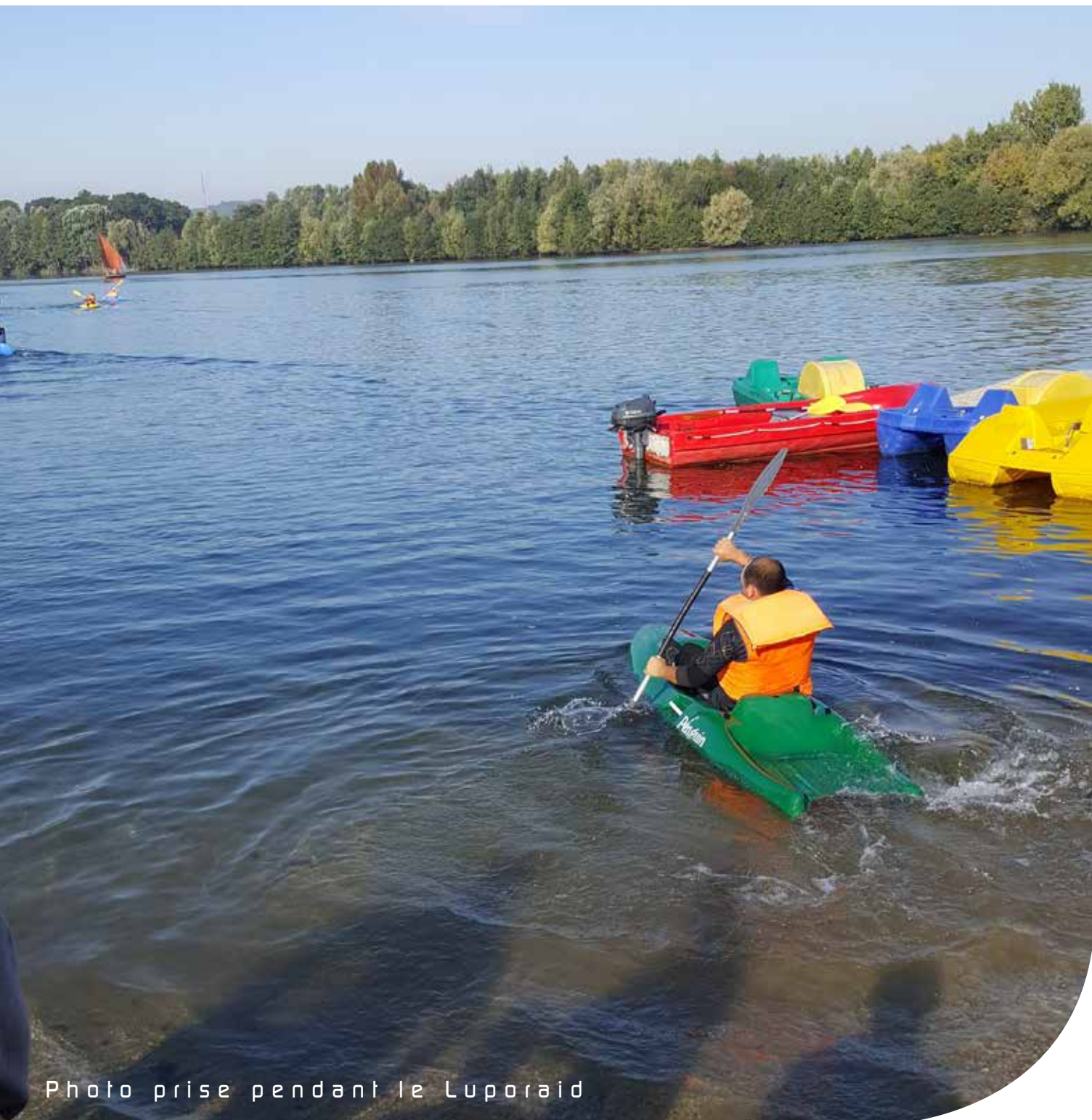
Photo prise pendant le Luporaïd