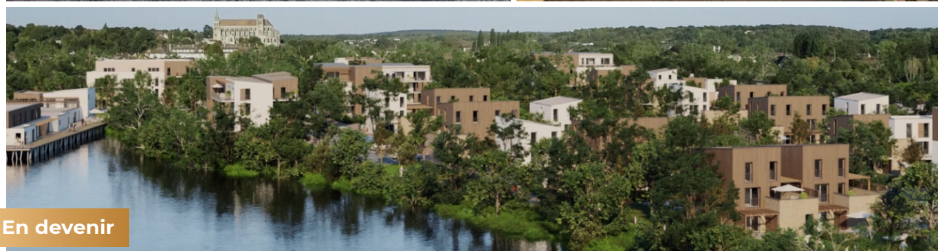
Futur quartier l'Orée du Lac