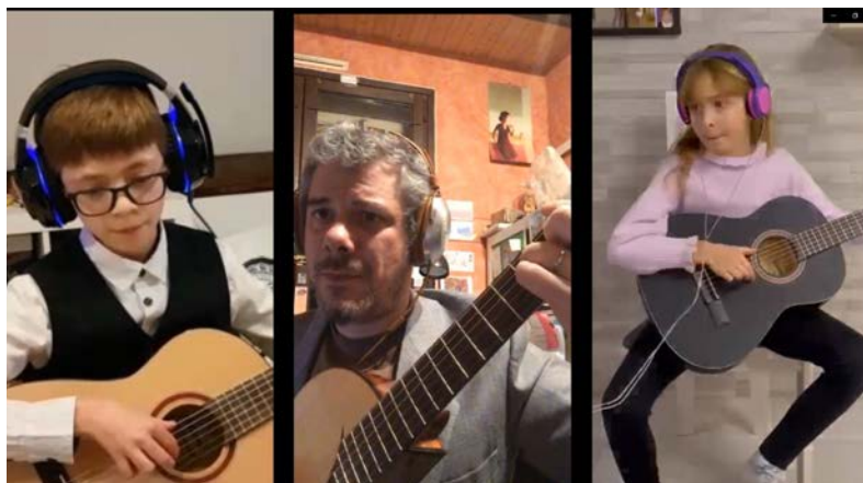
Exemple de cours de musique en ligne.

Les habitants savent que dans les prochains mois si nécessaire ils pourront encore compter sur eux.