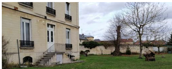
Futur site la Maison de la Petite Enfance

Nous déployons beaucoup d'efforts pour ouvrir une Maison de la Petite Enfance à l'emplacement d'un ancien bâtiment municipal en face de la gare, propriété maintenant de l'ACSO. Nous souhaitons y organiser une combinaison originale de services : une micro-crèche pour les familles, un relai pour les assistantes maternelles mais aussi les parents, ainsi que des locaux pour professions médicales autour de la petite enfance. En 2020, nous avons signé un contrat de bail et nous avons avancé sur la définition des travaux nécessaires.