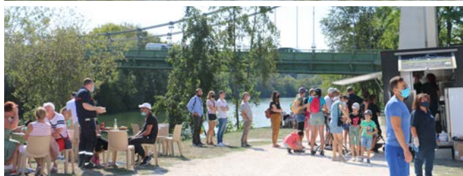
Fête de la Rivière

Nous travaillons sur la sécurisation de la rue d'Hardillière . Les problèmes de cette rue sont nombreux et ont fait l'objet d'une présentation précise en janvier dernier au Conseil Municipal : vitesse excessive du trafic de transit, sécurité insuffisante des riverains et des piétons, vieillissement de la voirie et des réseaux souterrains. L'identification des solutions techniques avance bien et a déjà fait l'objet d'un échange avec le Conseil Départemental ( puisque'il s'agit d'une route départementale ).