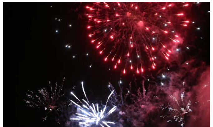
Fête de la libération, feu d'artifice

De même, nos manifestations ont dû s'adapter aux contraintes et nous avons dû reporter voire annuler une grande partie de notre programme festif. Dès le mois d'août, nous avons profité du répit sanitaire et organisé des festivités importantes en imposant le port du masque : fête de la Musique, feu d'artifice, fête de la Rivière et Journées Européennes du Patrimoine.