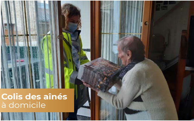
Colis des aînés à domicile