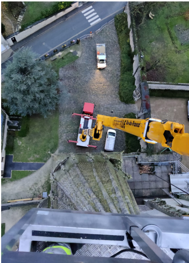
Travaux d'urgence sur l'Abbatiale

Malgré le temps important passé à gérer la crise du Covid, et malgré la difficulté de trouver des fournisseurs et des prestataires, nous avons avancé sur d'autres travaux du quotidien. On peut citer la reprise totale du marquage de la voirie, la création d'une véritable placette rue du Peuple, la restauration du mur au-dessus de la mairie. Nous avons également lancé des travaux d'urgence sur l'Abbatiale , avec la pose de grilles anti-pigeons, le remplacement du paratonnerre et du coq. Sur ce bâtiment, nous avons également lancé un diagnostic d'ensemble du bâtiment.