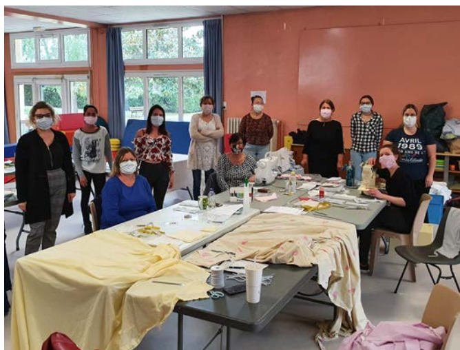
Fabrication de masques par les agents de la mairie.

Cette crise n'est pas que sanitaire . La crise économique ne fait que commencer. Nous sommes tous amenés à réfléchir sur le bon équilibre entre protection des personnes et préservation de l'activité. De même, dans des domaines où l'on ne peut que chercher la moins pire des solutions, la difficulté de savoir à quelle règle se référer a aussi engendré une véritable crise administrative , qui ne doit pas se transformer en crise politique.