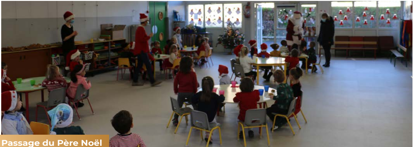
Passage du Père Noël dans les écoles