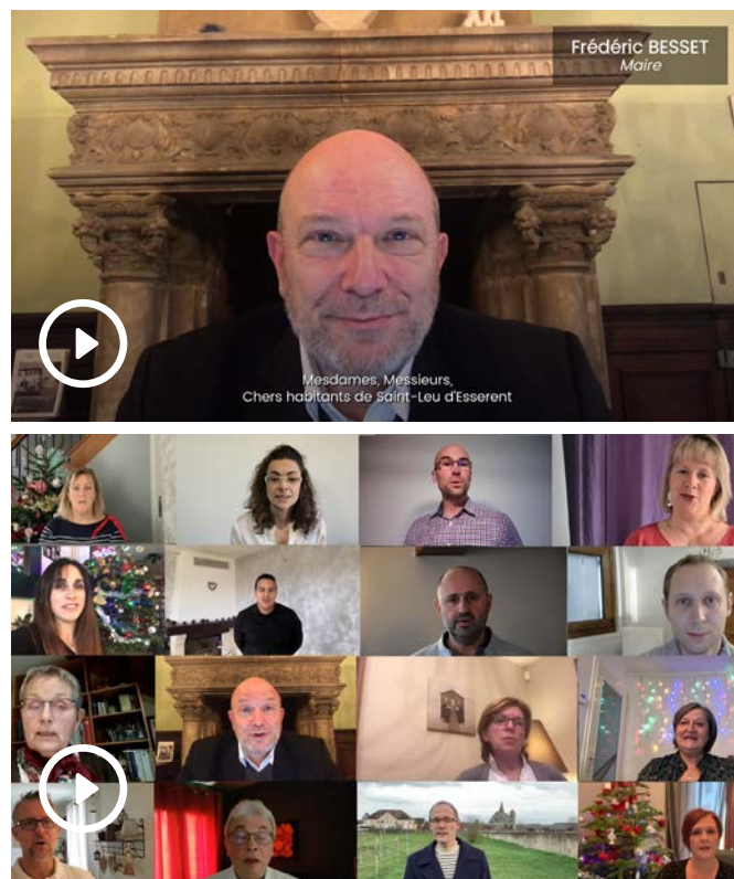
Vidéo des vœux du Maire et du conseil municipal du samedi 2 janvier 2021, disponible sur Facebook, Youtube et sur www.saintleudesserent.fr

Dans ce contexte difficile, j'ai eu quand même le plaisir de partager avec toute l'équipe municipale la réalisation d'une courte vidéo publiée juste après le réveillon. Ensemble, avec gravité, mais aussi avec humour et confiance dans l'avenir, nous vous avons présenté nos vœux sincères de santé et de bonheur . Je le refais ici avec plaisir.