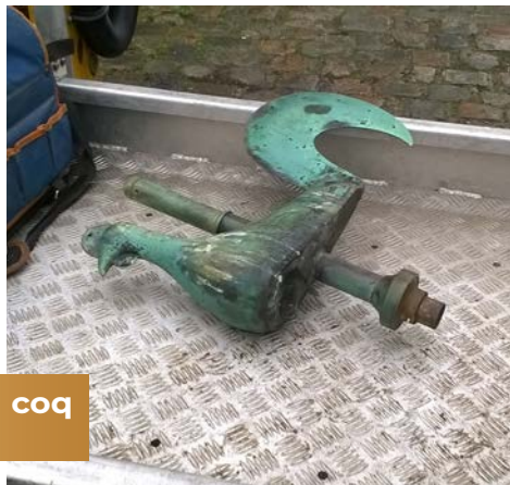
Changement du coq de l'Abbatiale