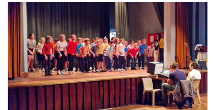
Restitution des interventions musicales dans l'école R. Carbon

*Liste complète des cours sur le site de la ville