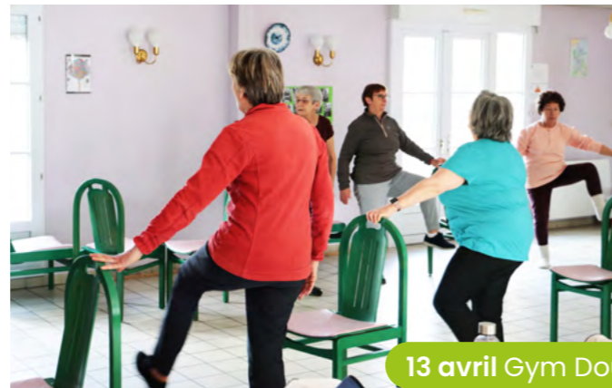
13 avril Gym Douce