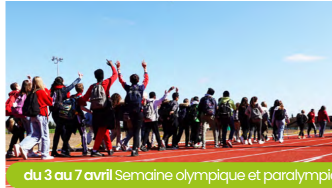
du 3 au 7 avril Semaine olympique et paralympique