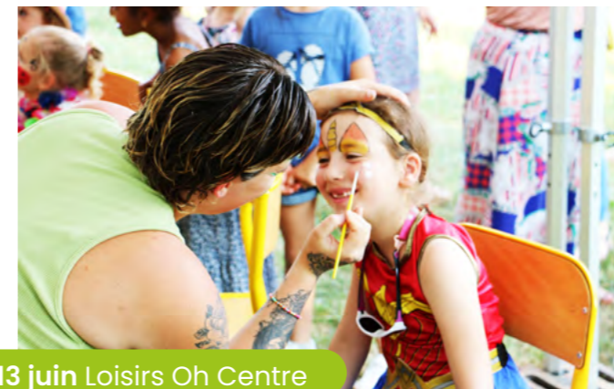
13 juin Loisirs Oh Centre