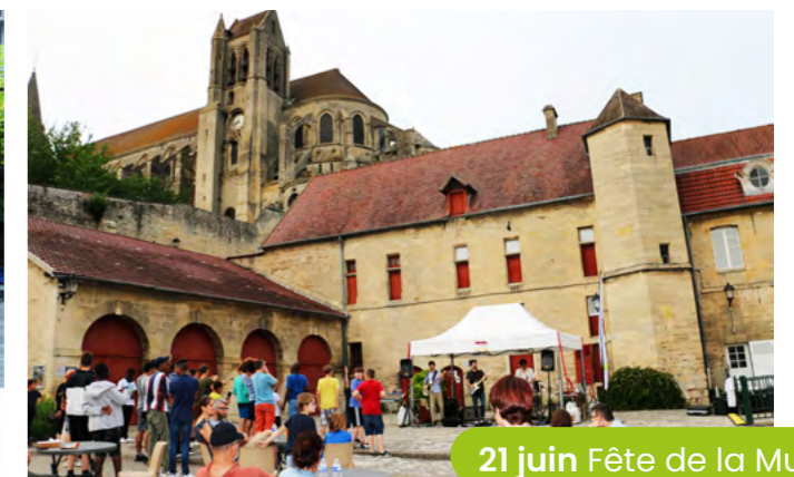
21 juin Fête de la Musique