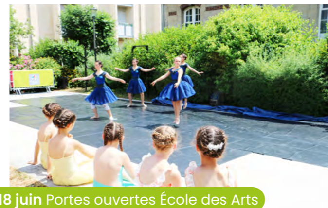
18 juin Portes ouvertes École des Arts