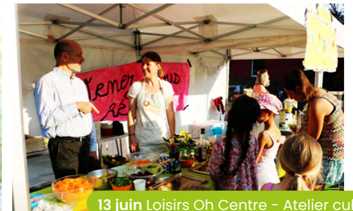
13 juin Loisirs Oh Centre - Atelier culinaire