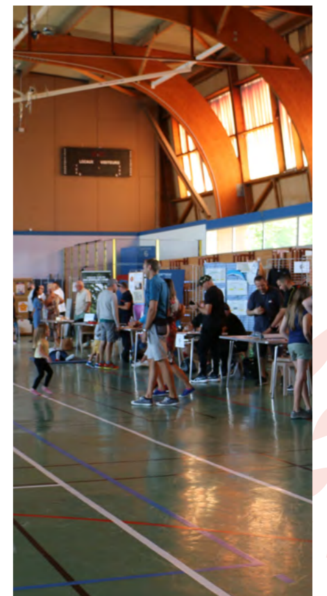
Fête des associations de 2022

Pour encourager le sport en milieu scolaire (hors heures obligatoires) 03 44 56 39 24 el.0601409F@ac-amiens.fr