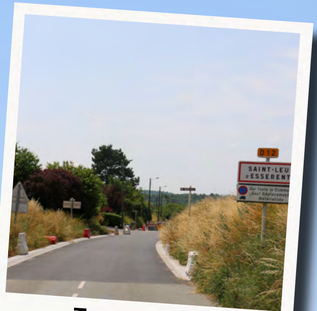
Travaux de la rue d'Hardillière