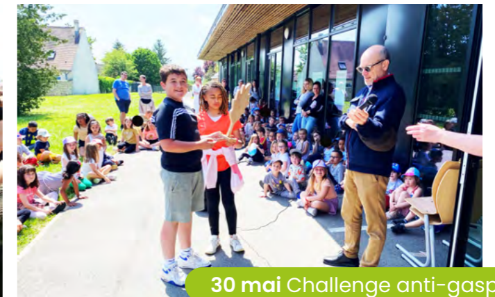
30 mai Challenge anti-gaspillage