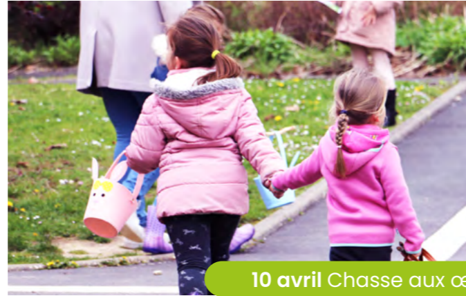
10 avril Chasse aux œufs