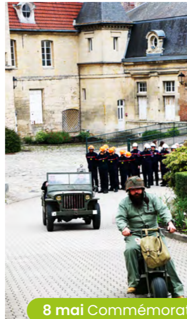
8 mai Commémoration