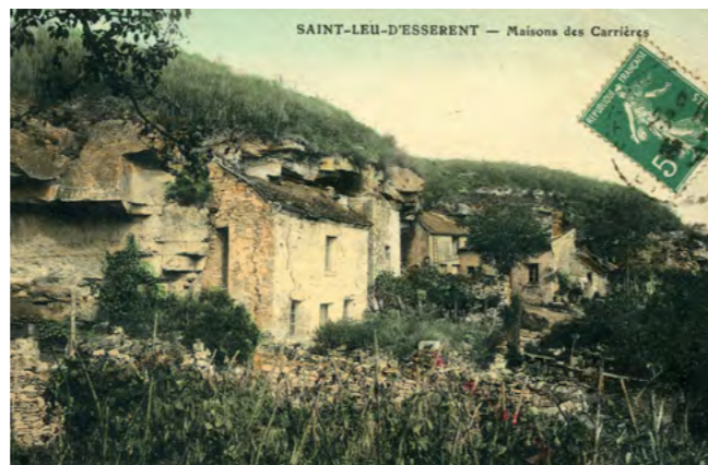
Vue de la rue du dernier Bourguignon

C'est ainsi qu'on la nomme aujourd'hui encore : « rue du dernier Bourguignon ».