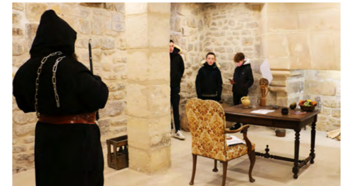
Escape Game - Féerie de Noël

L'École des Arts est un établissement artistique qui a pour mission l'enseignement et le développement des pratiques amateurs : musique, peinture, théâtre, danse.