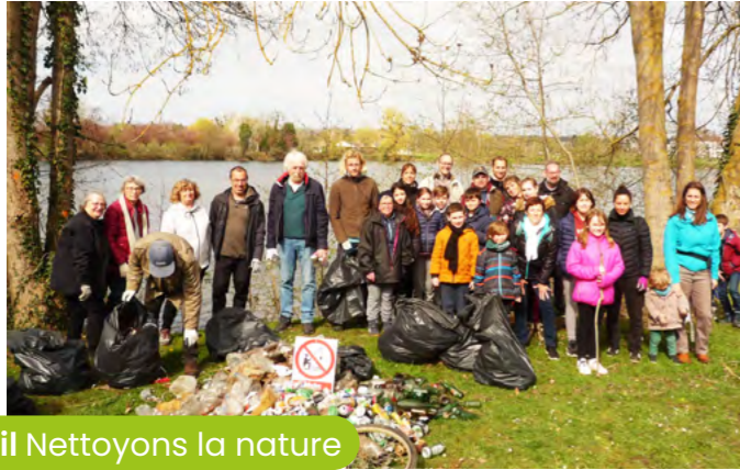
8 avril Nettoyons la nature