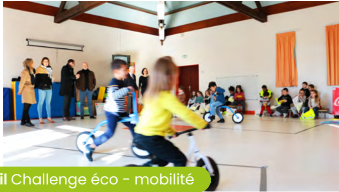
4 avril Challenge éco - mobilité