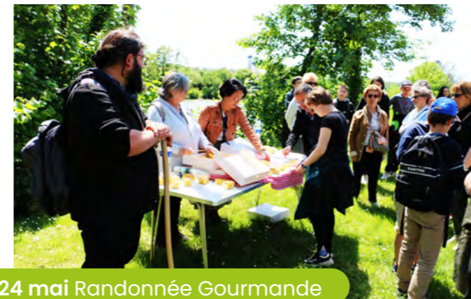
24 mai Randonnée Gourmande