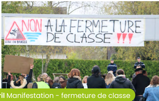
11 avril Manifestation - fermeture de classe