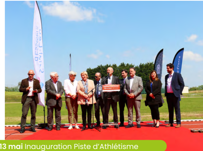
13 mai Inauguration Piste d'Athlétisme