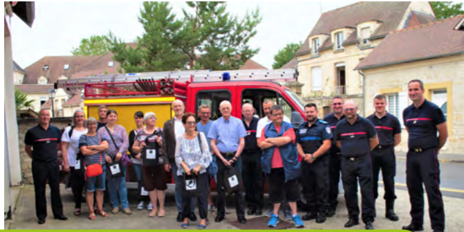
17 juin Réserve Commune de Sécurité Civile