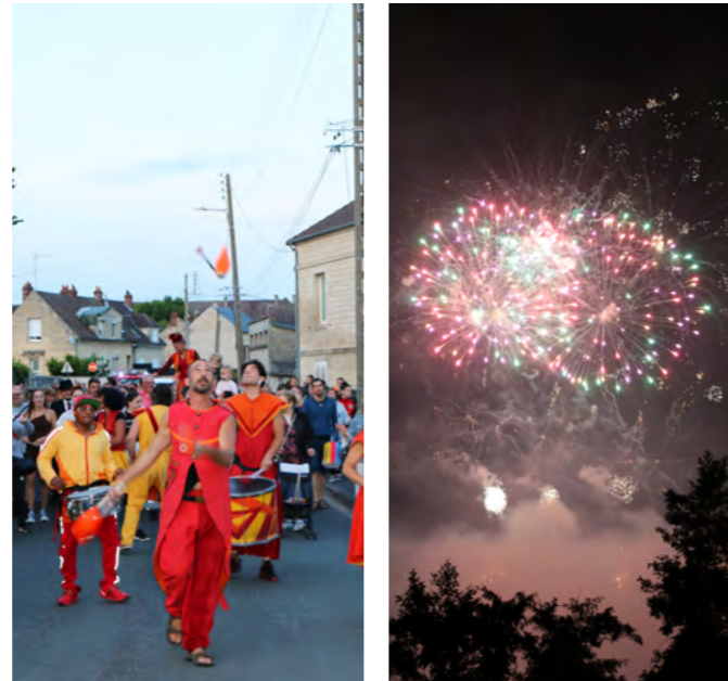
13 juillet Batucada et Feu d'Artifice