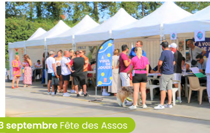
3 septembre Fête des Assos