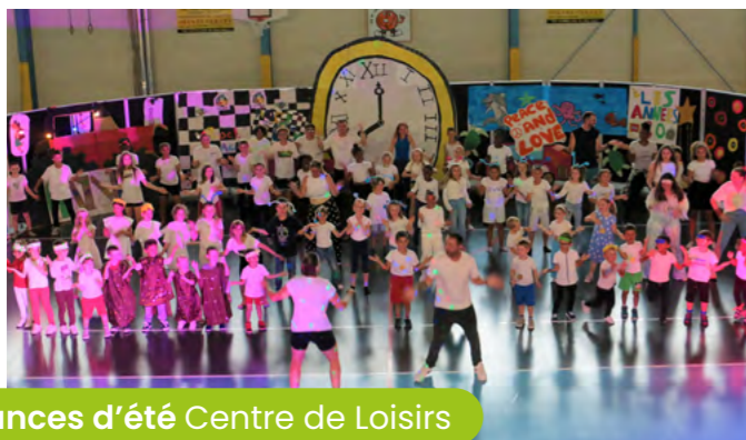
Vacances d'été Centre de Loisirs