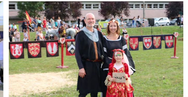
17 septembre Concours de costumes médiévaux