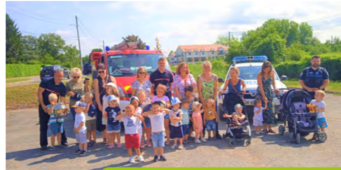
21 juin Pôle Sécurité à la Halte-Jeux