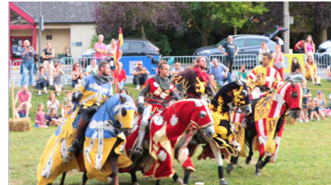
16 & 17 septembre Journées Européennes du Patrimoine