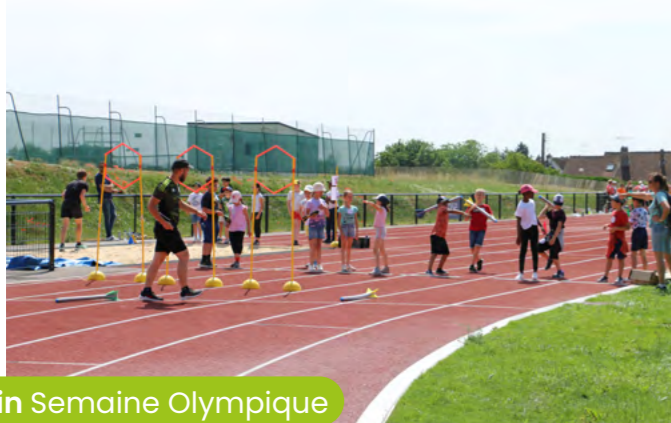
23 juin Semaine Olympique