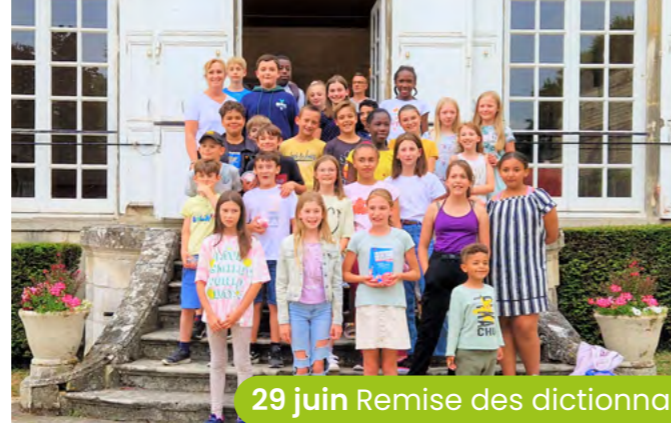
29 juin Remise des dictionnaires