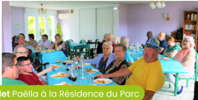
5 juillet Paëlla à la Résidence du Parc