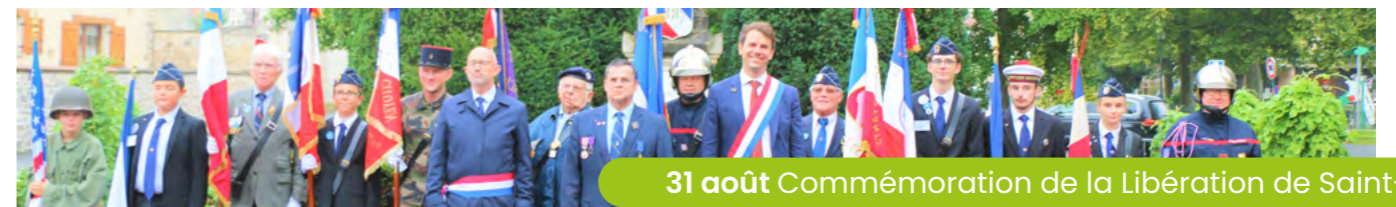
31 août Commémoration de la Libération de Saint-Leu