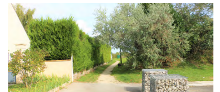
Sente piétonne en face du collège J. Vallès