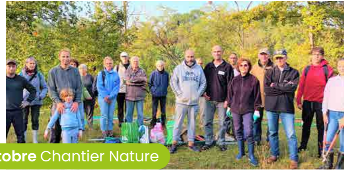
7 octobre Chantier Nature