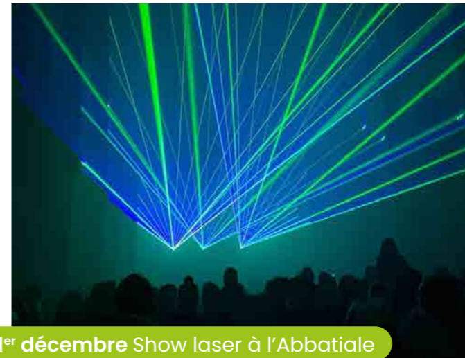
1 er décembre Show laser à l'Abbatiale