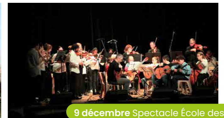
9 décembre Spectacle École des Arts