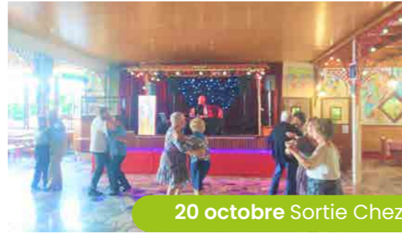
20 octobre Sortie Chez Gégé

Organisé dans le cadre de la Semaine Bleue