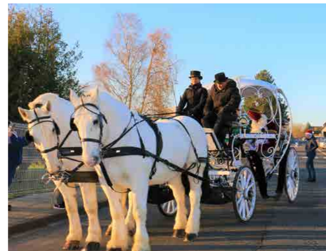
2 décembre Parade de Saint-Nicolas