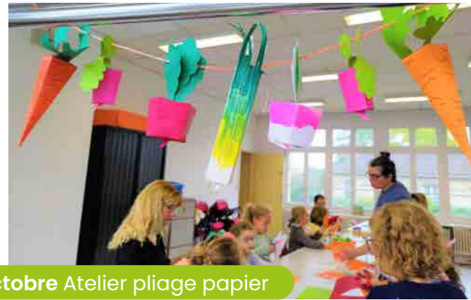
21 octobre Atelier pliage papier

Organisé dans le cadre de la Semaine Bleue