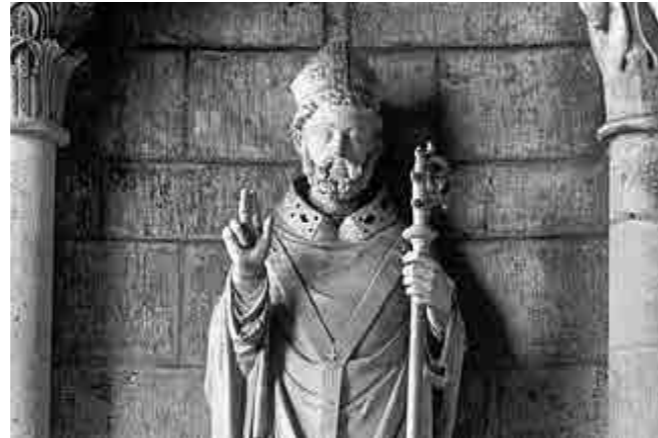
Statue de Saint-Leu

Voilà pourquoi vous retrouvez régulièrement le symbole du loup dans notre ville. Par exemple avec la statue d'un loup dans le jardin du Prieuré, ou encore sur les visuels de certains événements organisés par la ville comme les Journées Européennes du Patrimoine ou la Cérémonie des diplômés.