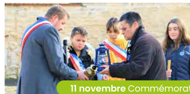
11 novembre Commémoration