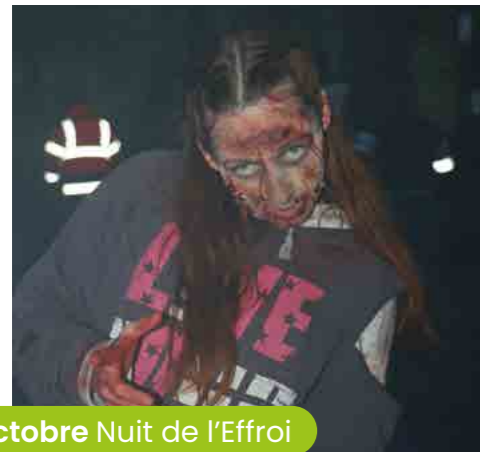
27 octobre Nuit de l'Effroi