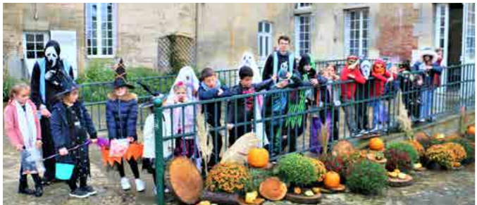
Vacances d'octobre Centre de Loisirs