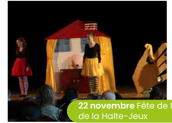
22 novembre Fête de Noël de la Halte-Jeux