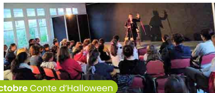
28 octobre Conte d'Halloween