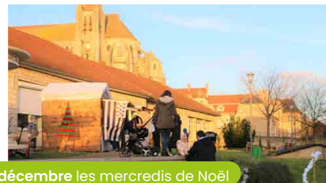
décembre les mercredis de Noël