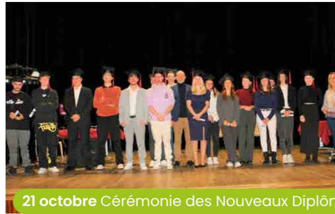
21 octobre Cérémonie des Nouveaux Diplômés