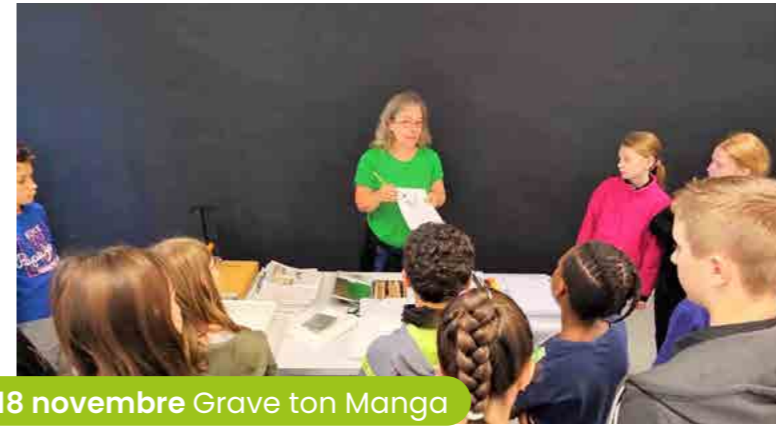
18 novembre Grave ton Manga