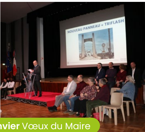
16 janvier Vœux du Maire