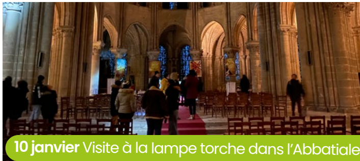
10 janvier Visite à la lampe torche dans l'Abbatiale