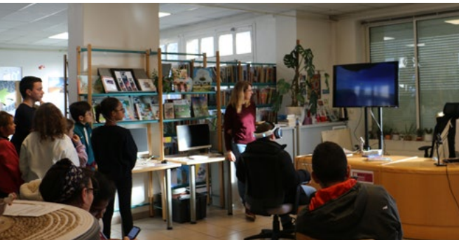
21 janvier Réalité Virtuelle à la Médiathèque