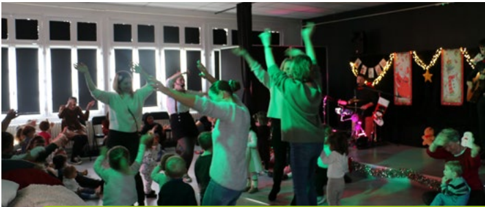
16 décembre Spectacle d'Hiver de la Halte-Jeux