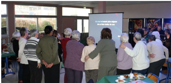
25 janvier Galette festive des Aînés