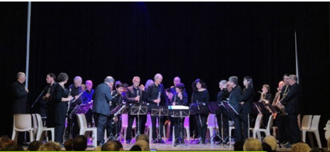
13 décembre Concert Orchestre Da Capo