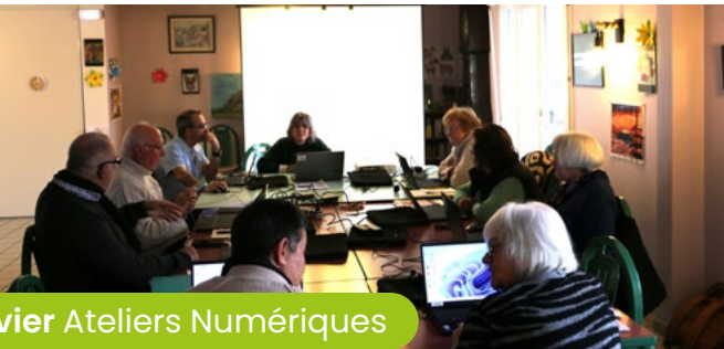
8 janvier Ateliers Numériques