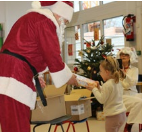
16 décembre le Père Noël dans les écoles