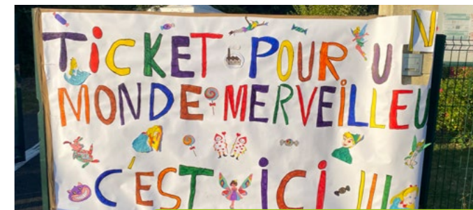
22 août Fête de fin de centre de loisirs