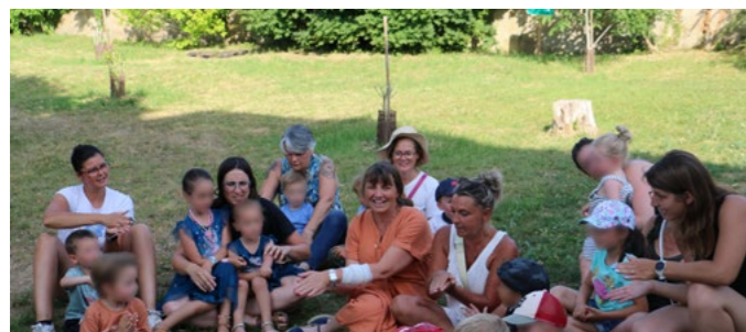
25 juin Goûter de fin d'année du Relais Petite Enfance