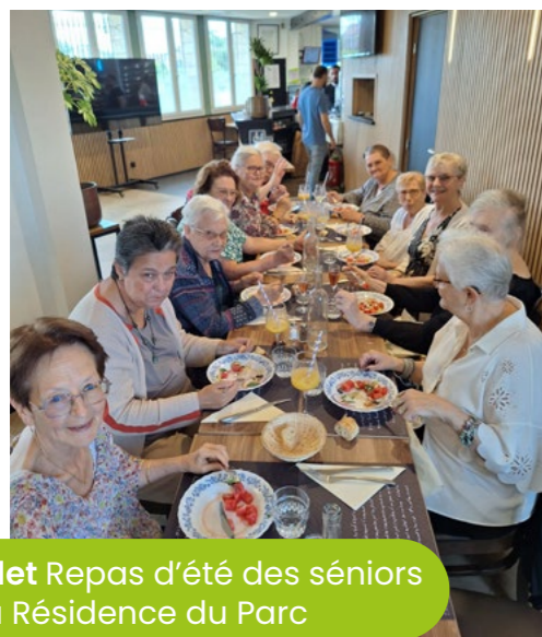
7 juillet Repas d'été des séniors de la Résidence du Parc