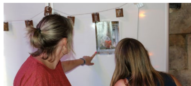
21 août Escape Game Mystère à Saint-Leu