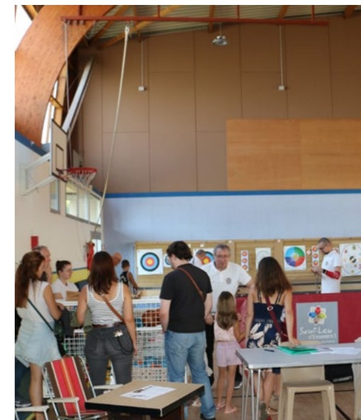
7 septembre Fête des Associations