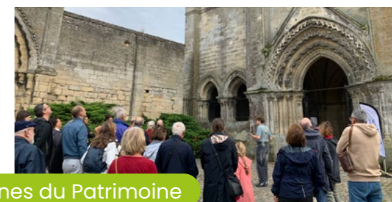
20 et 21 septembre Les Bâisseurs - Journées Européennes du Patrimoine