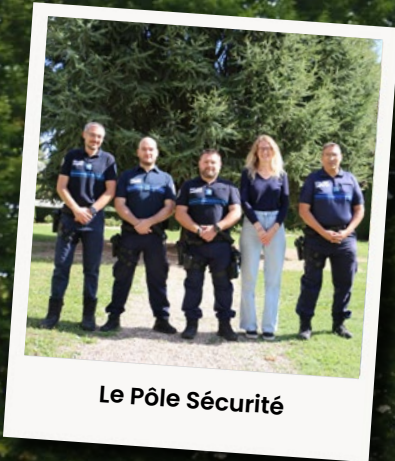
Le Pôle Sécurité