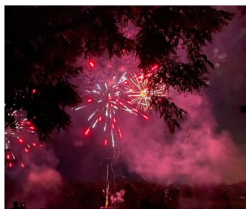
13 juillet Son et Lumières et Retraite aux flambeaux