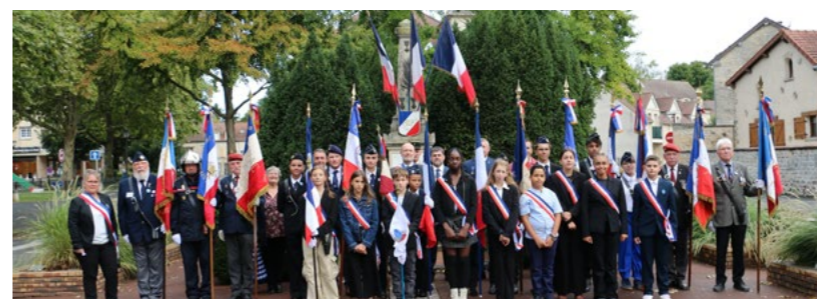
31 août Commémoration de la Libération de Saint-Leu