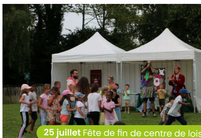
25 juillet Fête de fin de centre de loisirs