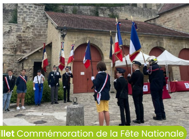
14 juillet Commémoration de la Fête Nationale