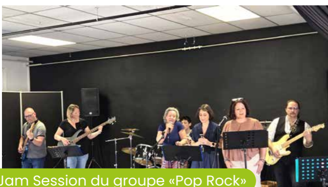
9 mai Jam Session du groupe «Pop Rock»