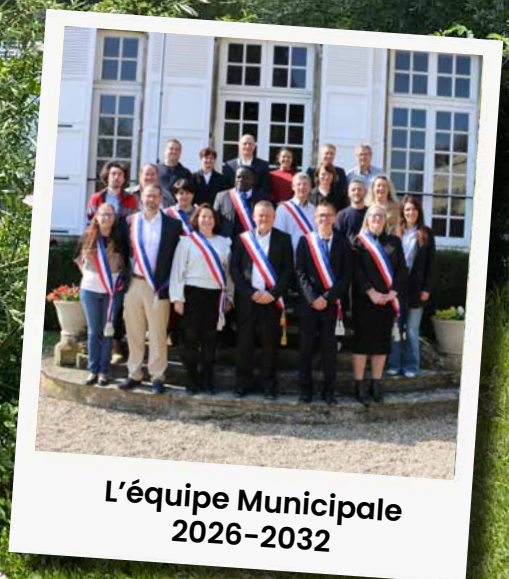
L'équipe Municipale 2026-2032