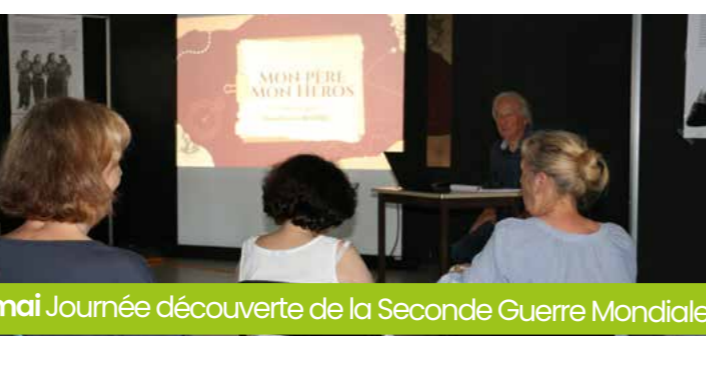
27 mai Journée découverte de la Seconde Guerre Mondiale