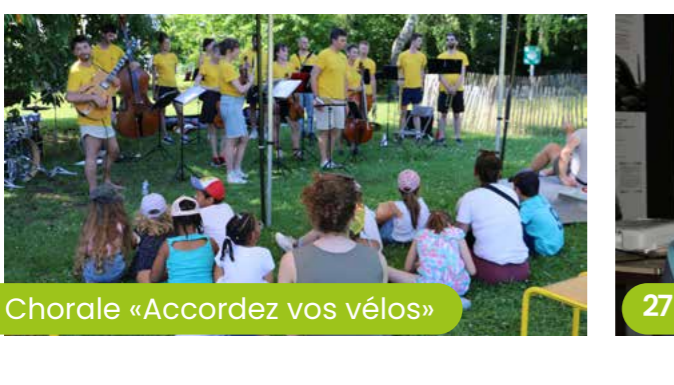
27 mai Chorale «Accordez vos vélos»