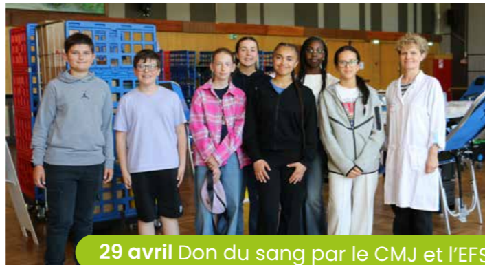
29 avril Don du sang par le CMJ et l'EFS