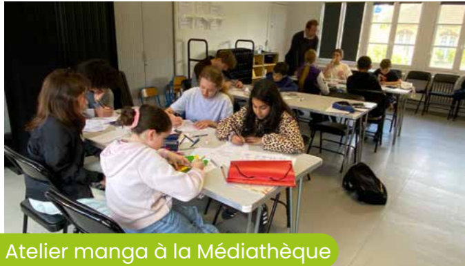
21 avril Atelier manga à la Médiathèque