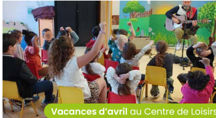
Vacances d'avril au Centre de Loisirs