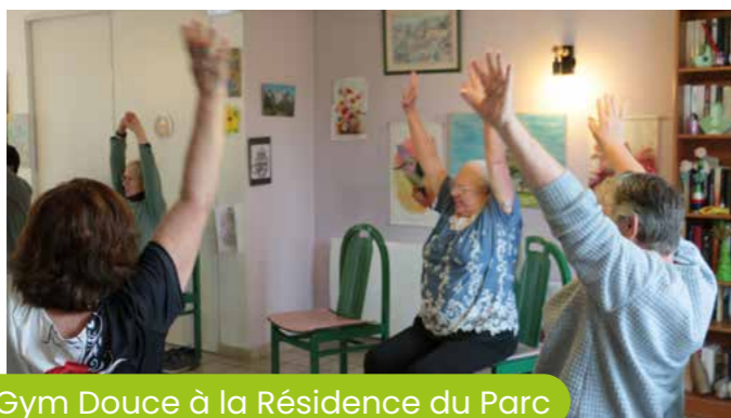
5 mai Gym Douce à la Résidence du Parc