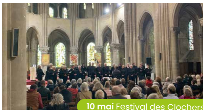
10 mai Festival des Clochers