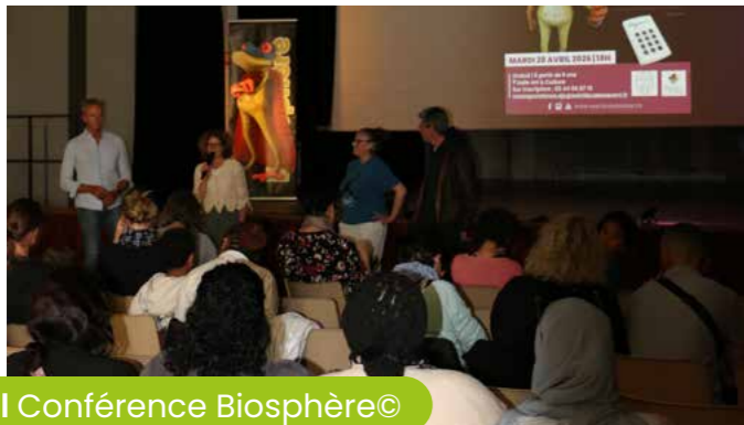
28 avril Conférence Biosphère©