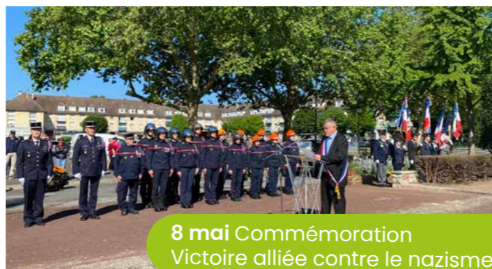
8 mai Commémoration Victoire alliée contre le nazisme